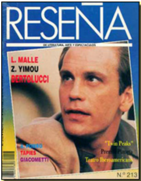
RESEÑA, 1991 NUM. 213 PP. 20

Sábado, 27 de Marzo de 2010 18:38 - Actualizado Jueves, 29 de Abril de 2010 16:18