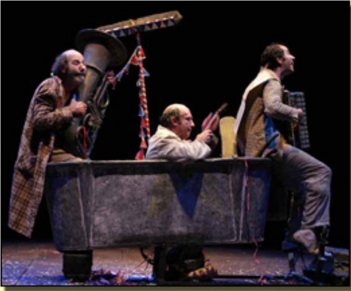
Aunque lo que definitivamente separa a las c

Sábado, 27 de Marzo de 2010 20:18 - Actualizado Jueves, 29 de Abril de 2010 11:53