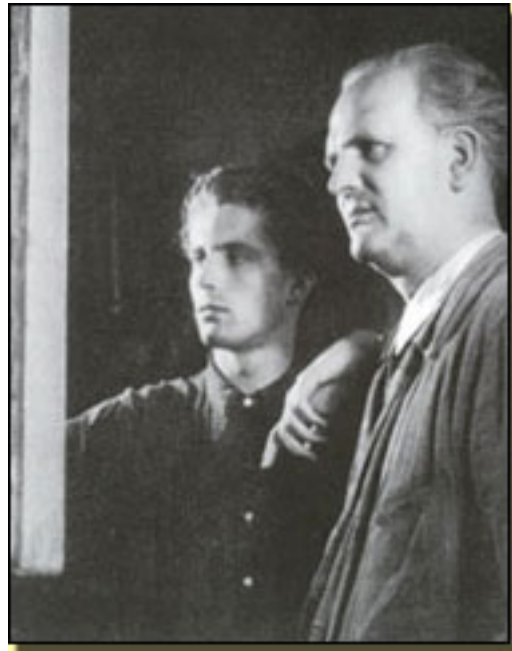
MICHAEL Y EDGARD ENDE

Se han encontrado similitudes entre las pinturas de Edgar y las imágenes que sugiere Michael en sus