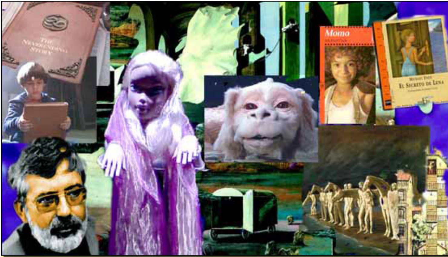
MICHAEL ENDE Y SU MUNDO

Jueves, 25 de Marzo de 2010 14:44 - Actualizado Jueves, 13 de Mayo de 2010 11:43