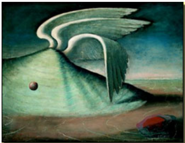
PINTURA de EDGARD ENDE Michael Ende estudió en la

Jueves, 25 de Marzo de 2010 14:44 - Actualizado Jueves, 13 de Mayo de 2010 11:43