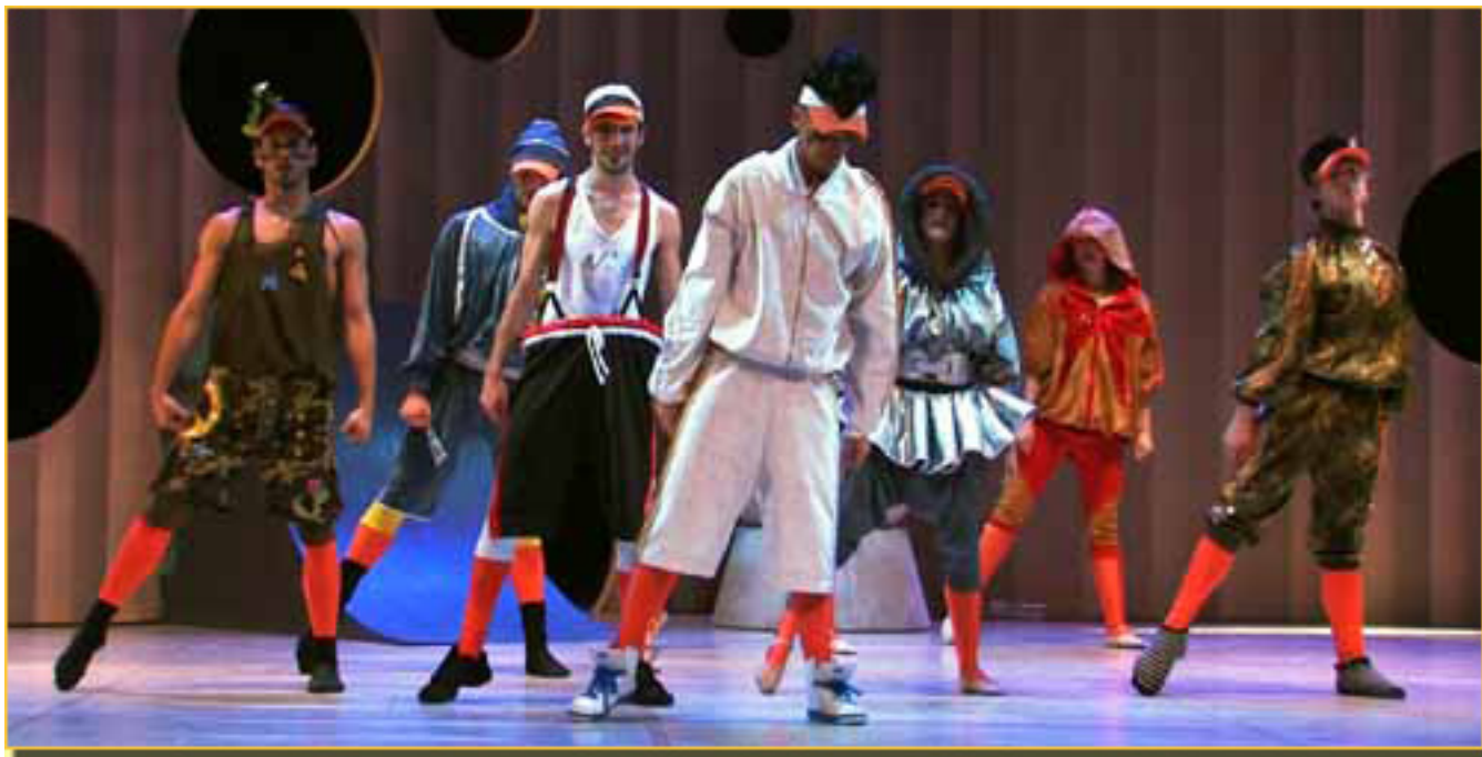
EL PATITO FEO

Sábado, 20 de Marzo de 2010 17:53 - Actualizado Jueves, 13 de Mayo de 2010 12:04