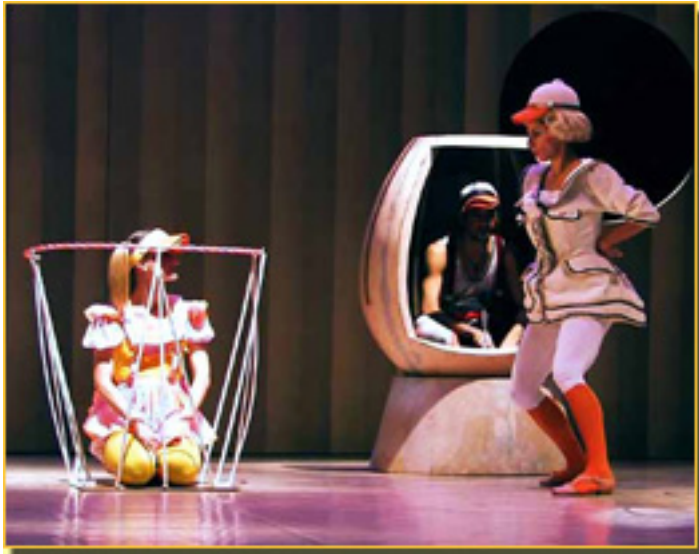
EL PATITO FEO (MAMÁ PATA)

Sábado, 20 de Marzo de 2010 17:53 - Actualizado Jueves, 13 de Mayo de 2010 12:04