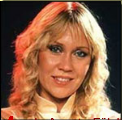
A de Agneta Fälskog