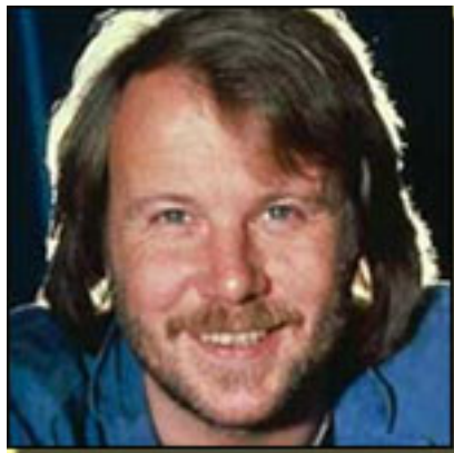
B de Benny Andersson