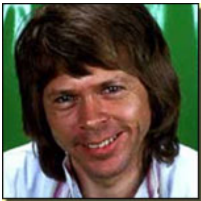
B de Björn Ulvaeus