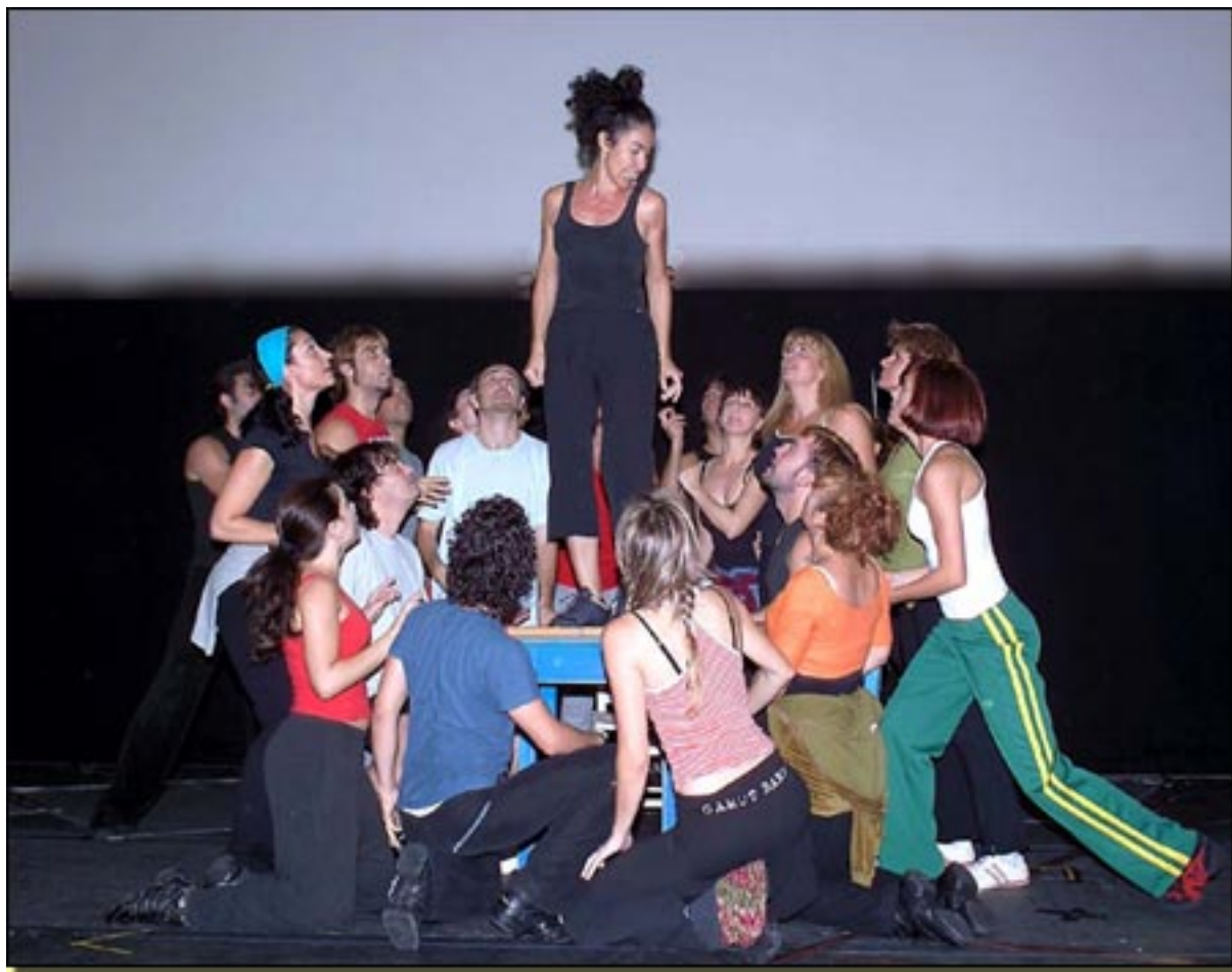
Nina y coro (Foto de ensayo)

■ Cuando en Mayo de 2004 el Teatro Apollo se inaugura con la ilustrada Mamma Mía! elegidos, para el