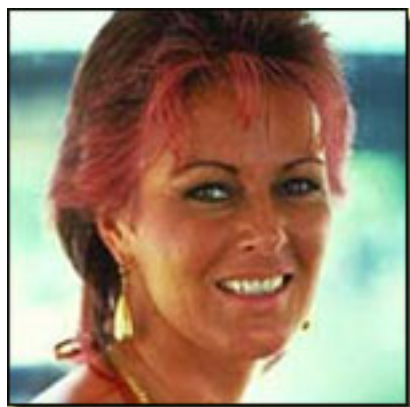
A de Anni-Frid Lyngstad