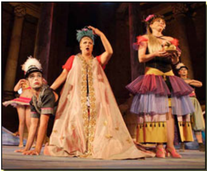
El joven Telémaco

Llegó a tener 33 representaciones seguidas y setenta y dos, durante la temporada. Llegó hasta los teatros privados como en el de la condesa de Montijo . Allí acudieron la infanta Isabel y su hija , los ministros de Brasil y de