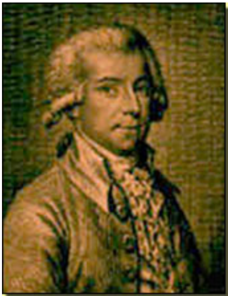
VICENTE MARTÍN Y SOLER

Vicente Martín y Soler es compositor de más de treinta óperas y una veintena de ballets para: