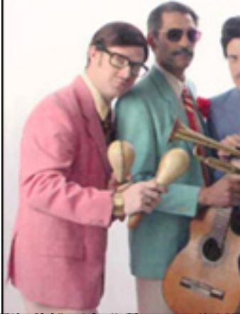
Los músicos de la banda 'Los Cuatro Cuatros' en un momento de su actuación.