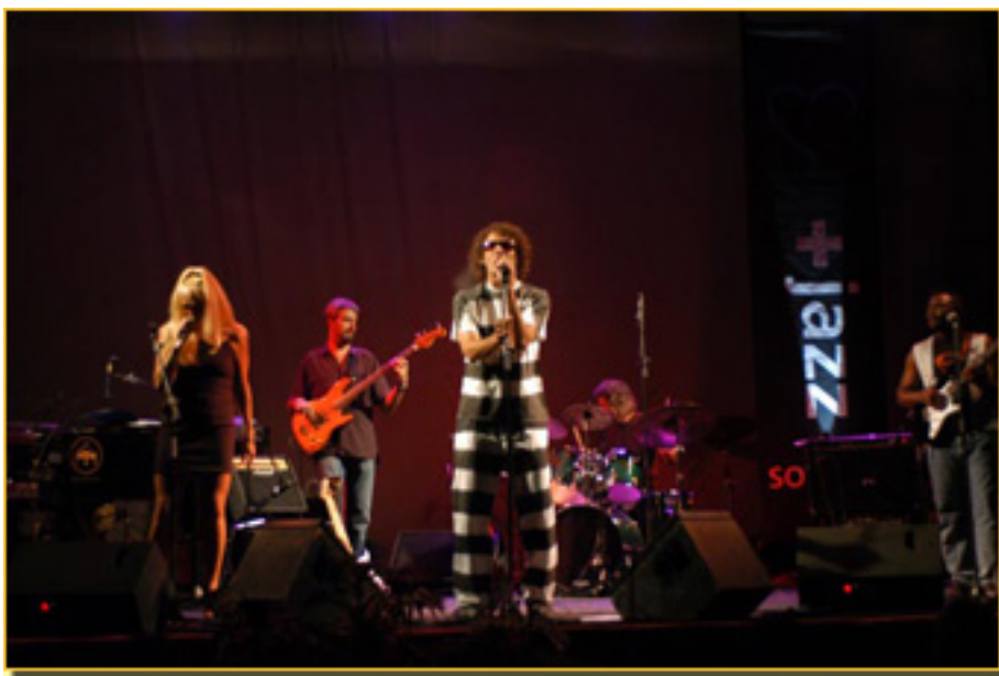
La Soto Big Band, es una