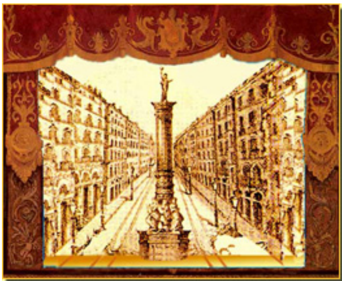
LA GRAN VÍA , 1886

■ La Gran Vía de Federico Chueca , no solamente fue un “boom” en su época sino que quedó en el repertorio y se representó con generosidad por todas las Compañías. Al Teatro de la Zarzuela ha venido en varias ocasiones. La última con versión de Adolfo Marsillach .