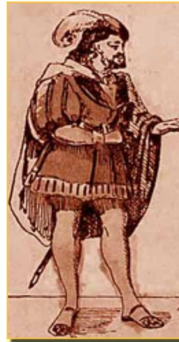
FAUSTO Y MARGARITA

En ese trastocar los sex Faust ba también la