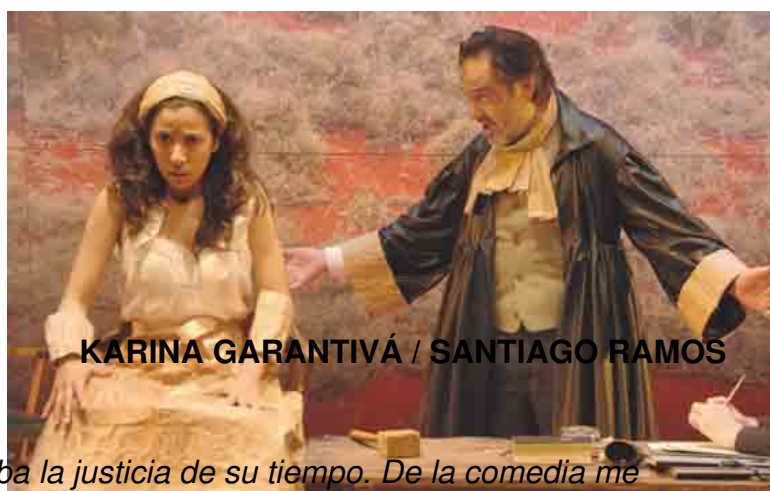
KARINA GARANTIVÁ / SANTIAGO RAMOS

Martes, 31 de Agosto de 2010 18:00 - Actualizado Domingo, 26 de Septiembre de 2010 06:55