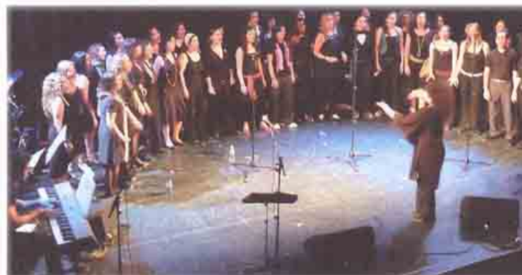
CORO DE GOSPEL Y MÚSICA MODERA UNIVERSIDAD COMPLUTENSE DE MADRID

En España se han creado Grupos Gospel . La diferencia de los españoles con los grupos americanos, según