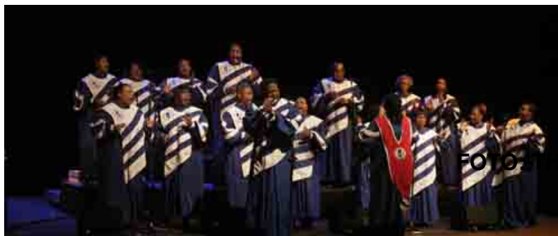
FO TO THE MISSISSIPPI MASS CHOIR