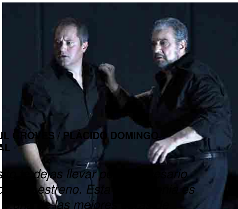
PAUL BROWN / PLÁCIDO DOMINGO

Plácido Domingo (Orestes) reconoce que tras el ensayo general