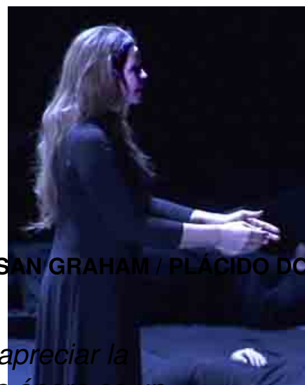
SUSAN GRAHAM / PLÁCIDO DO

- Su mayor virtud es la intensidad, el dolor, la emoción y una serie de