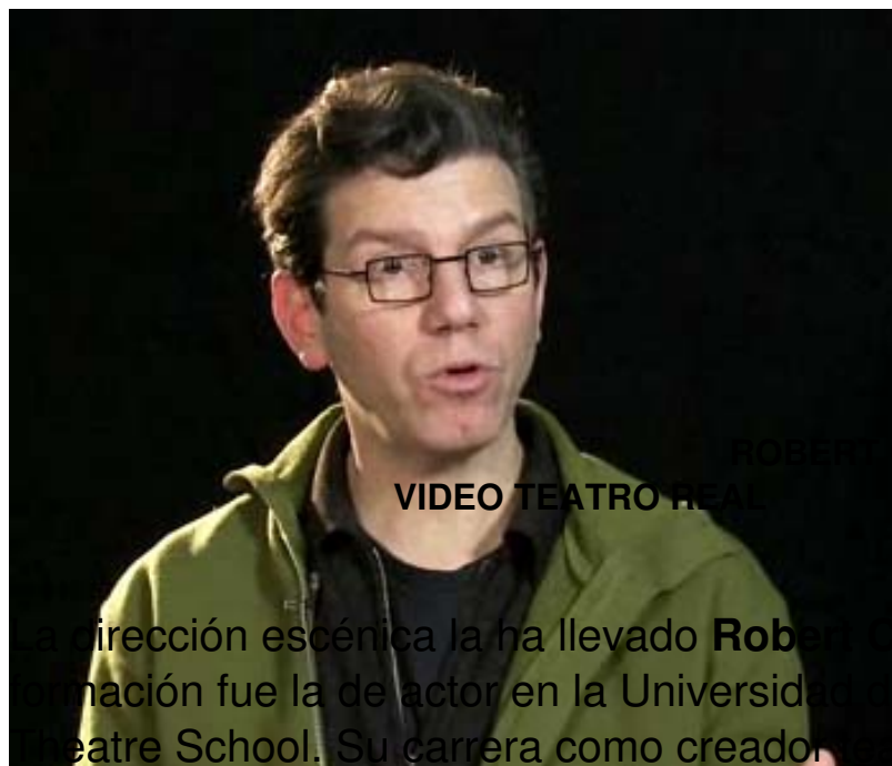
ROBERT CARSEN VIDEO TEATRO REAL

La dirección escénica la ha llevado Robert Carlsen (Canadá), cuya primera formación fue la de actor en la Universidad de York y en el Bristol Old Vic Theatre School. Su carrera como creador teatral se ha combinado con las realizaciones operísticas, por las que se le han concedido premios internacionales. No es la primera vez que dirige en el