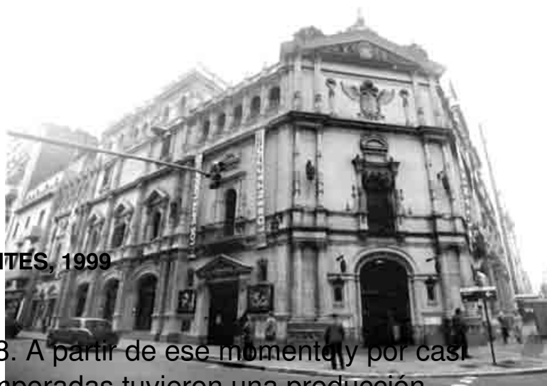
TEATRO CERVANTES, 1999

El Teatro Cervantes se reabrió en 1968. A partir de ese momento y por casi un período de casi tres décadas, las temporadas tuvieron una producción teatral heterogénea, que tuvo que lidiar con los vaivenes políticos, incluyendo la época de la dictadura.