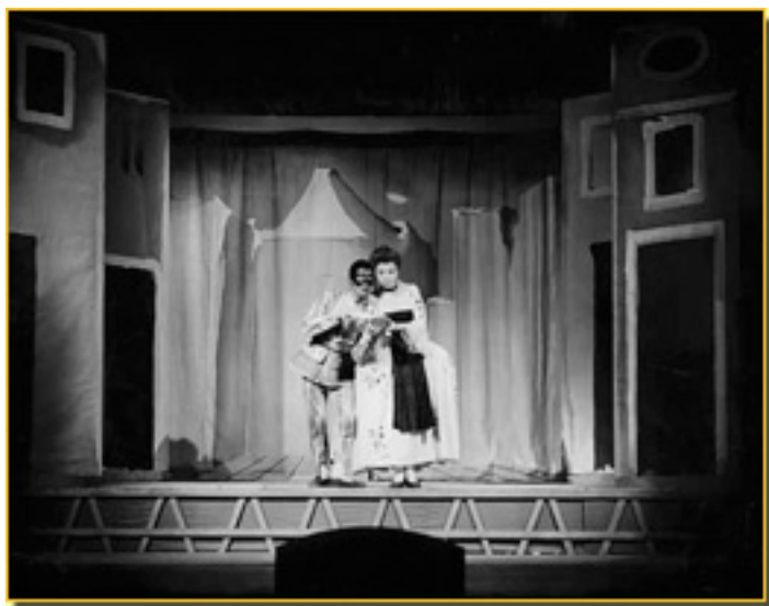
ARLEQUINO, SERVIDOR DE DOS AMOS (VERSIÓN DE GIORGIO STREHELER) (PICCOLO DE MILÁN, 1947)

Esta gente logró que se desarrollara también la comedia de Coste