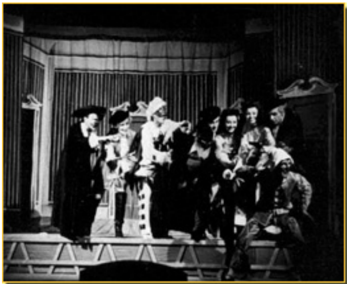
ARLEQUINO, SERVIDOR DE DOS AMOS (VERSIÓN DE GIORGIO STREHELER) (PICCOLO DE MILÁN, 1947)

Jueves, 15 de Abril de 2010 15:08 - Actualizado Viernes, 20 de Marzo de 2015 21:24