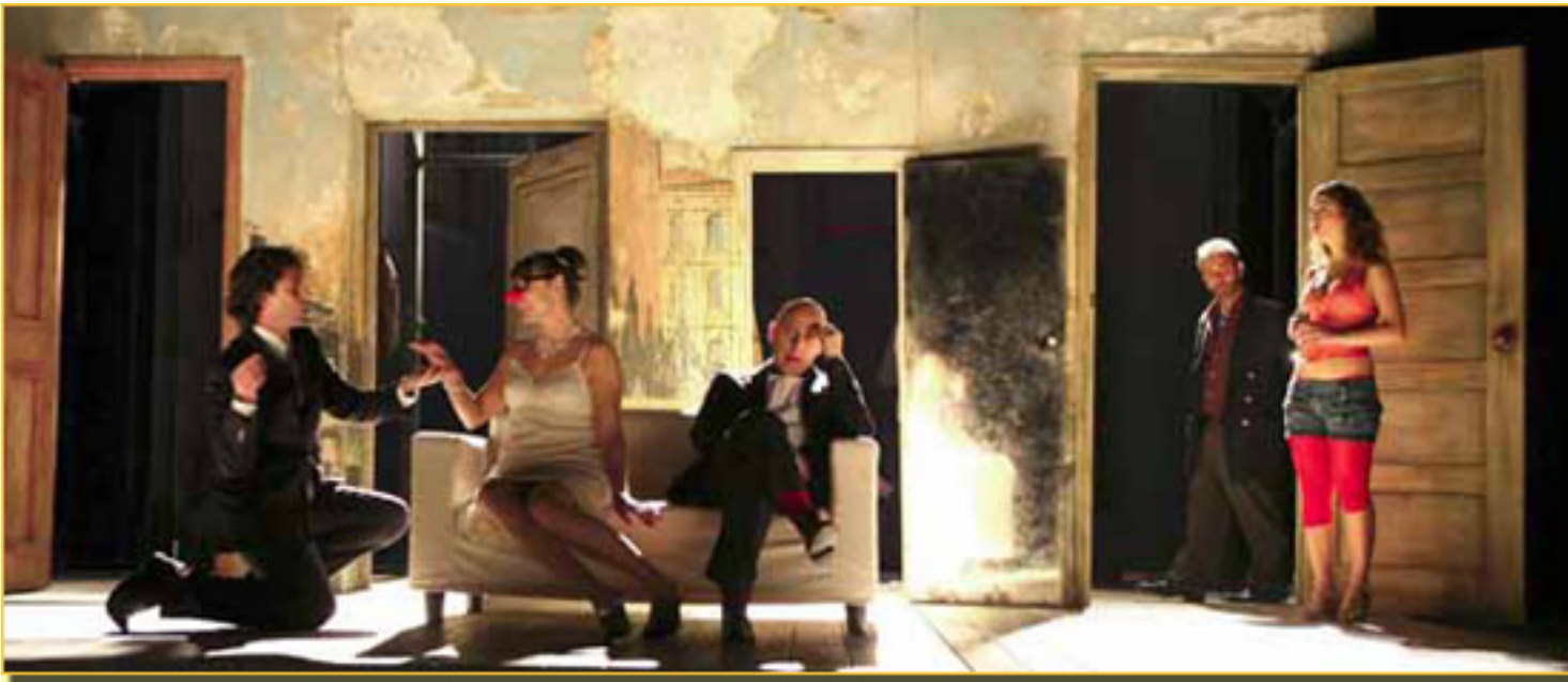
ARGELINO, SERVIDO DE DOS AMOS (TEATRO LA ABADÍA, 2008)

■ Ante todo conviene recordar Zanni el origen histórico y social del Zanni es el a