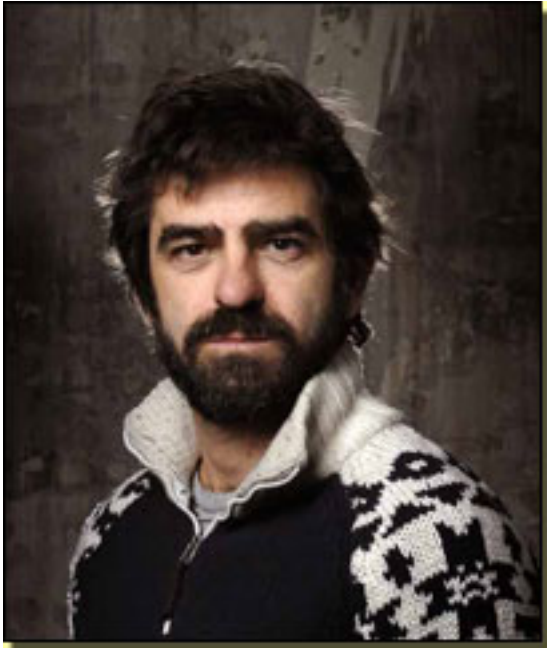
GONZALO CUNILL (JAVIER CERCAS)

Jueves, 15 de Abril de 2010 10:14 - Actualizado Viernes, 14 de Mayo de 2010 12:31