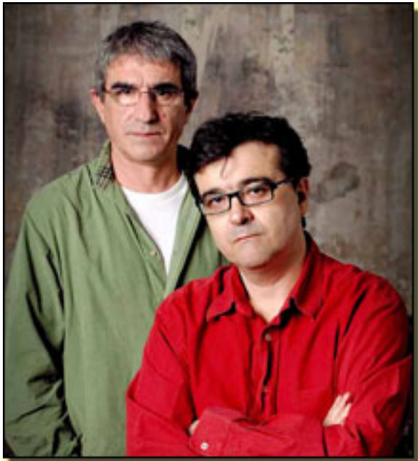
JOAN OLLÉ/ JAVIER CERCAS