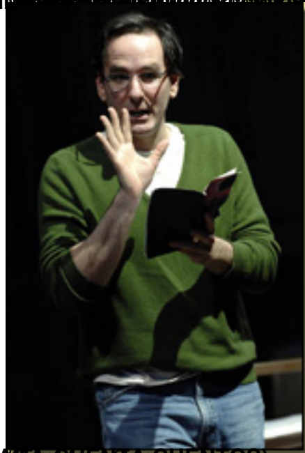
El hombre que se cayó de la cama (Cripple), Alcazra de Teatro