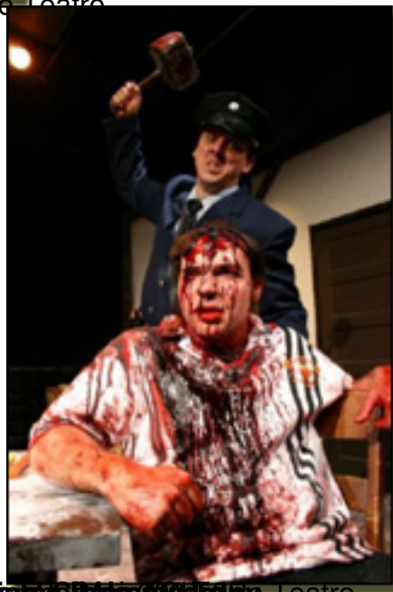
El hombre que se cayó de la cama (Cripple), Alcazra de Teatro