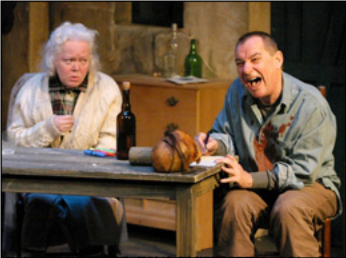
El hombre que se cayó de la cama (Cripple), Alcazra de Teatro

Jueves, 15 de Abril de 2010 10:59 - Actualizado Jueves, 13 de Mayo de 2010 16:32