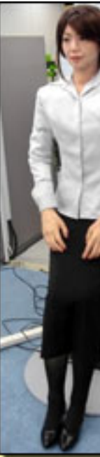
• REPLIEE Q2

. Mujer androide de piel sintética con a