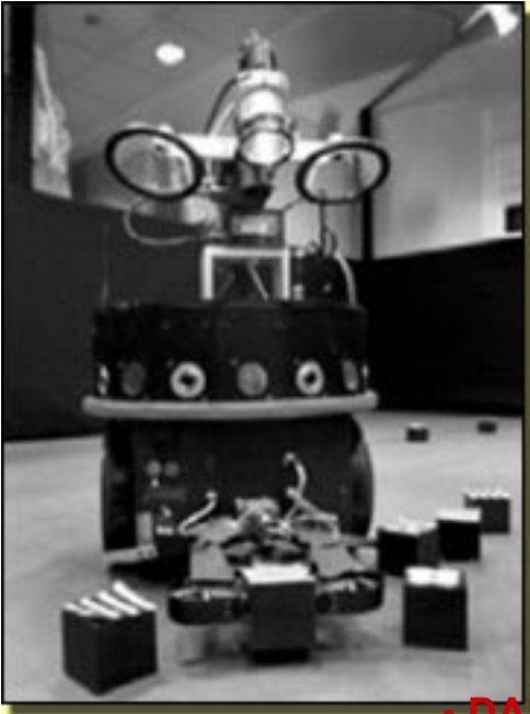
• DARWIN VII

Miércoles, 14 de Abril de 2010 16:47 - Actualizado Jueves, 13 de Mayo de 2010 15:01