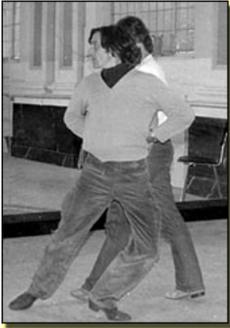
ANTONIO GADES

Miércoles, 14 de Abril de 2010 15:31 - Actualizado Jueves, 13 de Mayo de 2010 14:41