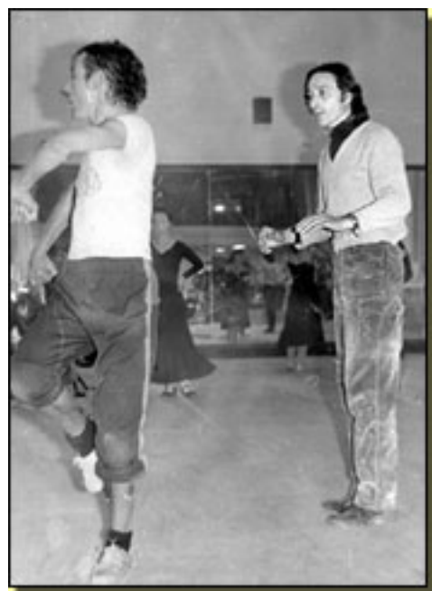
ANTONIO GADES (ABRIL 1980)