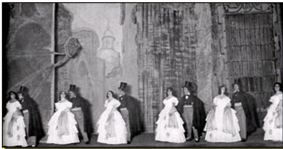
Decorado 1923 (Manuel Fontanals) Coro de románticos