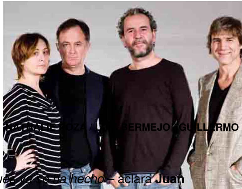
ALBERO SAN JUAN

Después, los autores Juan Mayorga y Juan Cavestany trabajaron a partir de estas improvisaciones a las que asistieron. Se encargaron de ordenar los sueños y emociones de los actores.