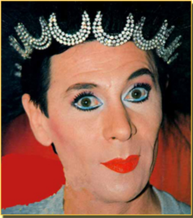
ESTE ES MI LUGAR (1987)

Llegó a España con lo que sabía hacer entonces: un fino espectáculo de mimo,