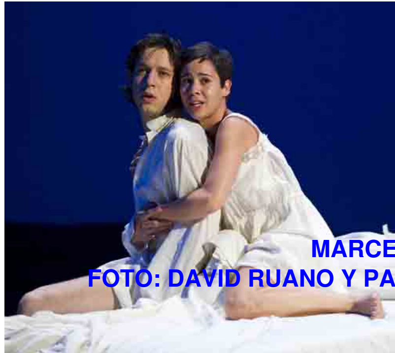
MARCEL BORRRÁS / C FOTO: DAVID RUANO Y PACO AMATE

Lunes, 08 de Agosto de 2011 18:11 - Actualizado Lunes, 15 de Agosto de 2011 18:16