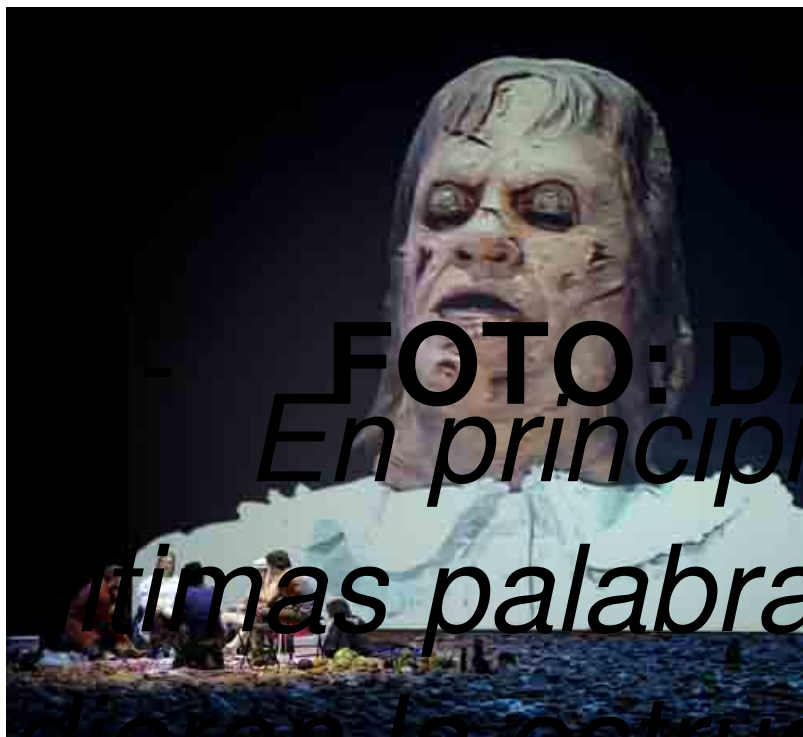
En principio la siete

últimas palabras me dieron la estructura