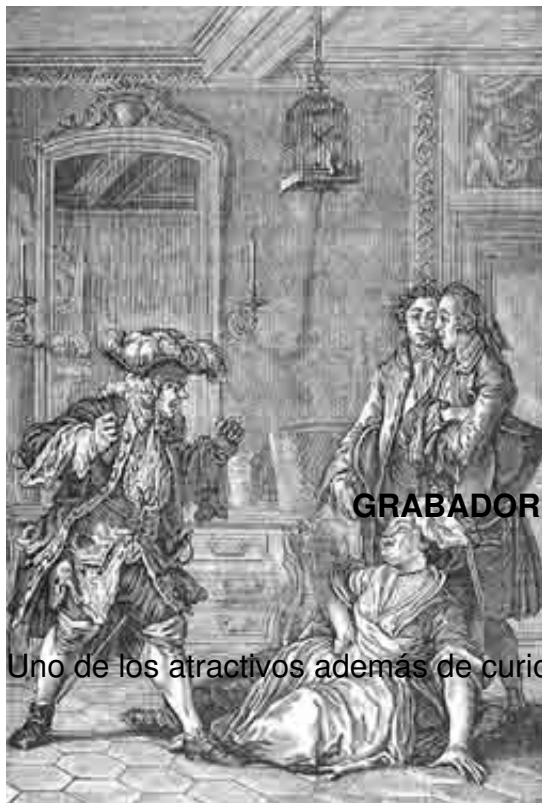
LE BOURGEOIS BENTILOMME GRABADOR: MOREAU, LE JEUNE

Uno de los atractivos además de curiosidad, es que todo lo vemos iluminado por velas.