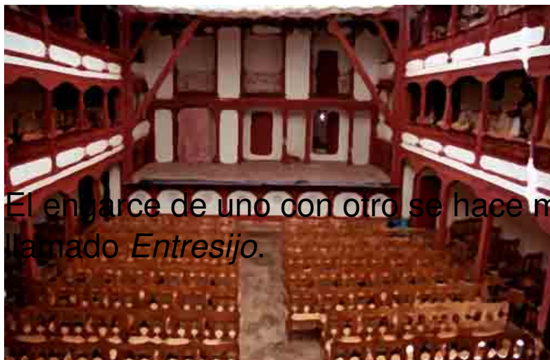
□ CORRAL DE COMEDIAS, ALMAGRO

El engarce de uno con otro se hace mediante lo que se ha llamado Entresijo .