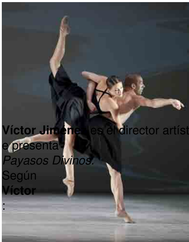
LAMOV COMPAÑÍA DE DANZA qu