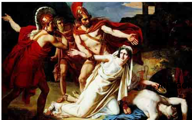
ANTÍGONA Y SU HERMANO

En total hay 3 Antígonas y ello puede parecer extraño o repetitivo. Blanca asegura que no: