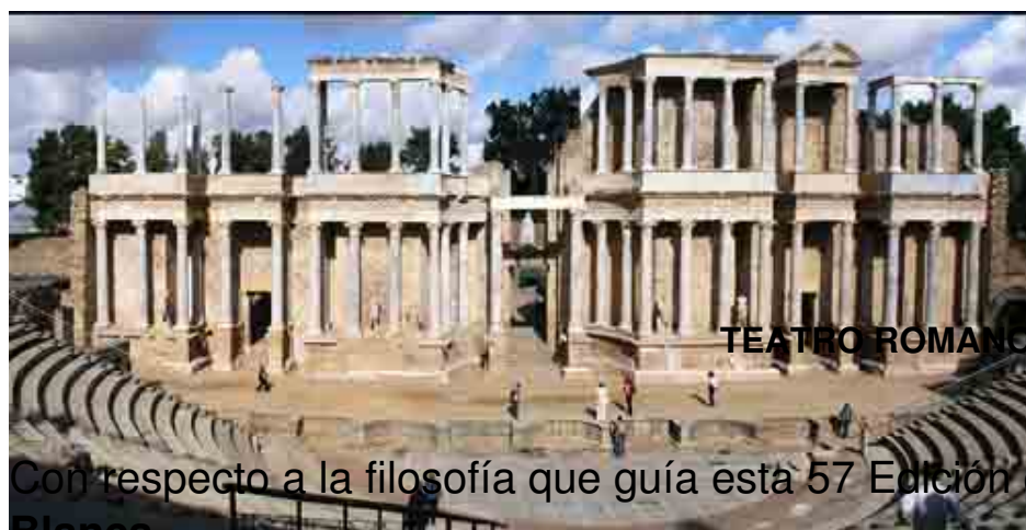
TEATRO ROMANO (MÉRIDA)