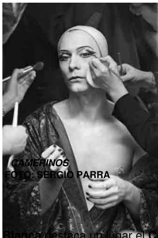
I CAMERINOS

Blanca destaca un lugar el Cripto-pórtico , que comparte con la Plaza del Templo de Diana – próxima sede del Festival -, el Templo Romano, la Alcazaba la exposición de