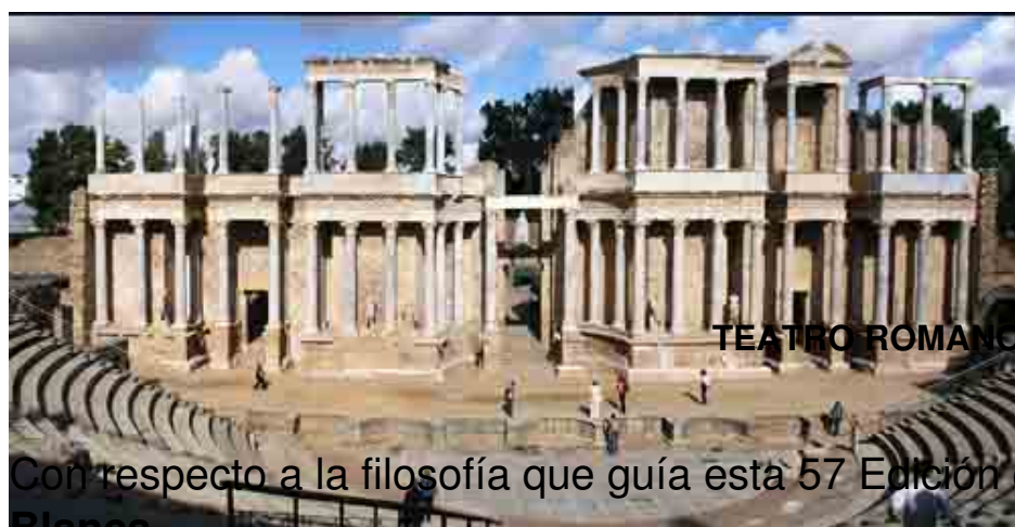
TEATRO ROMANO (MÉRIDA)