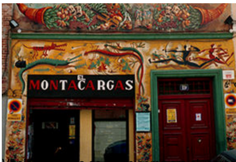
SALA EL MONTACARGAS

Venía la prueba de fuego como era el representarla ante un público más allá de su amigos. La Sala Montacargas le ofreció el poder representarla para que los programadores vinieran a verlo.