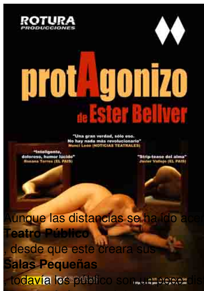
CARTEL DE PROMOCIÓN

Aunque las distancias se ha ido acercando entre las Salas alternativas y el Teatro Público