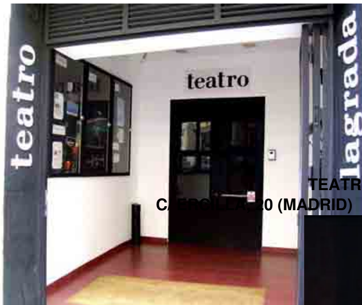
TEATRO LA GRADA C/ PROSPERIDAD 10 (MADRID)