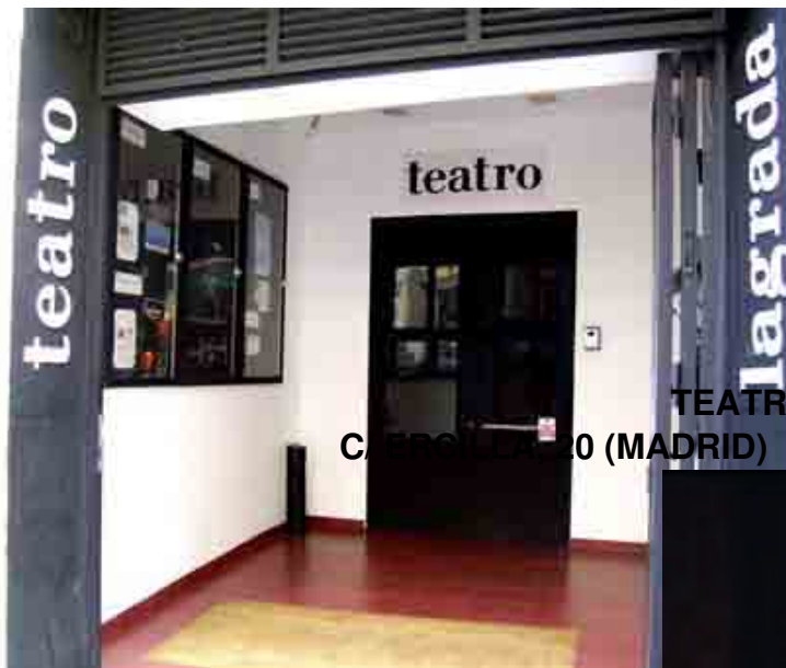
TEATRO LA GRADA CALLE DE CALZADA 10 (MADRID)