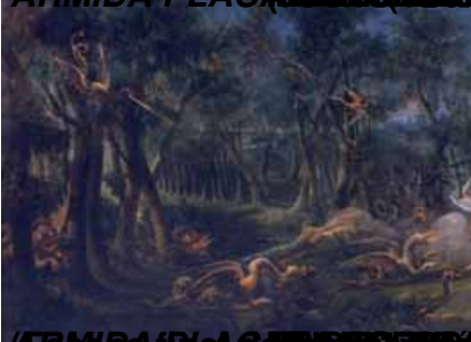
ARMIDA PLACERES DE LOS DIOS DE BELLAS ARTES DE SAN FERNANDO