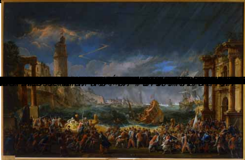
ARMIDA PLACERES DE LOS DIOS DE BELLAS ARTES DE SAN FERNANDO