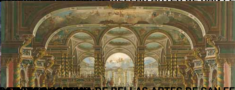
ARMIDA PLACERES DE LOS DIOS DE BELLAS ARTES DE SAN FERNANDO