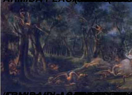
ARMIDA PLACERES DE LOS DIOS DE BELLAS ARTES DE SAN FERNANDO