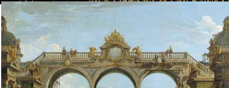
ARMIDA PLACERES DE LOS DIOS DE BELLAS ARTES DE SAN FERNANDO