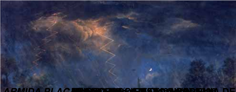
ARMIDA PLACERES DE LOS DIOS DE BELLAS ARTES DE SAN FERNANDO

Domingo, 19 de Mayo de 2013 06:49 - Actualizado Domingo, 19 de Mayo de 2013 14:43