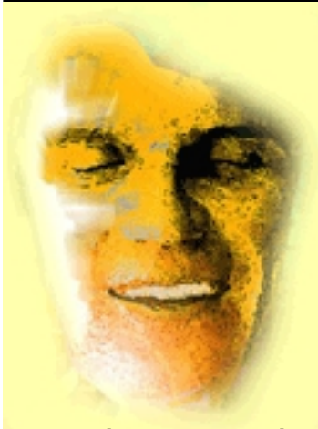
Más información: El Zoo de cristal de Galán-Vidal-Marsó Artículos de crítica