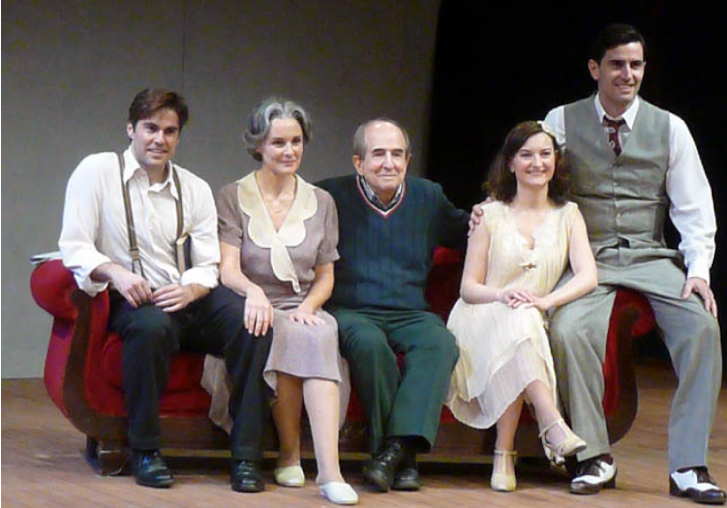
DIRECCIÓN: FRANCISCO VIDAL / SILVIA MARSÓ / FRANCISCO VIDAL / PILAR GIL / CARLOS G. COF

Martes, 11 de Noviembre de 2014 19:01 - Actualizado Sábado, 11 de Julio de 2015 11:01