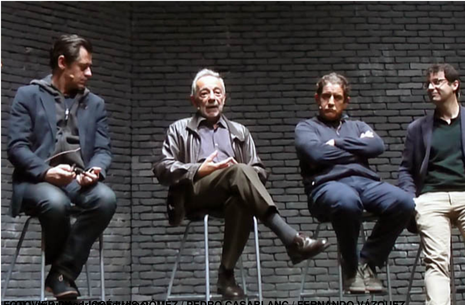
Foto: Olivier Py / José Luis Gómez / Pedro Casablanc / Fernando Vázquez

Martes, 25 de Noviembre de 2014 16:29 - Actualizado Martes, 25 de Noviembre de 2014 18:13