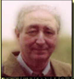
Copy Jerónimo López Mozo

Jueves, 25 de Diciembre de 2014 16:56 - Actualizado Jueves, 25 de Diciembre de 2014 17:26