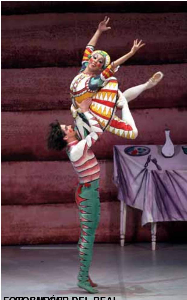
FOTOGRAFÍA DEL REAL

Miércoles, 23 de Octubre de 2013 11:19 - Actualizado Lunes, 30 de Junio de 2014 12:00