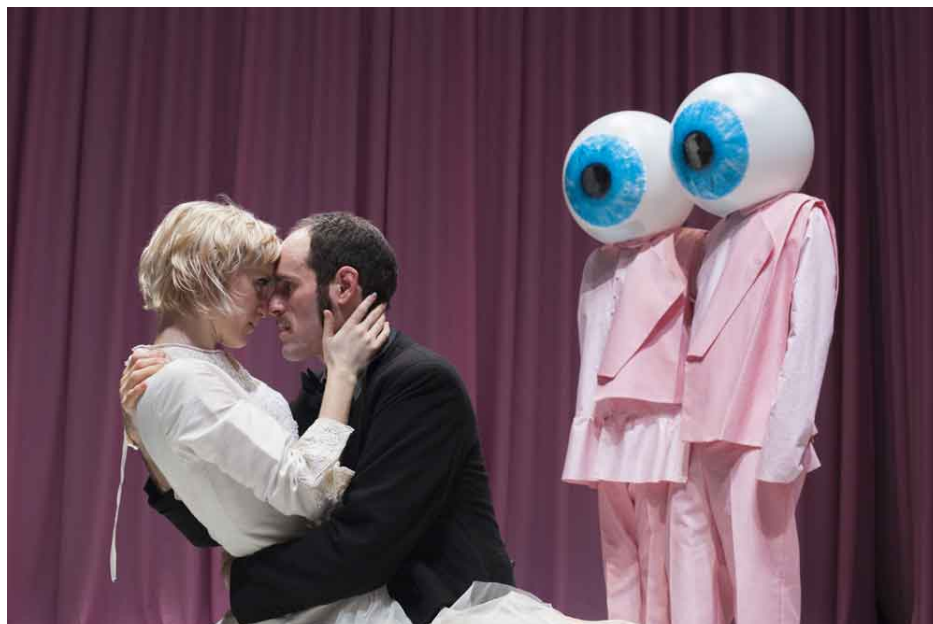
ANAËL SNECK / DIEGO ANIDO