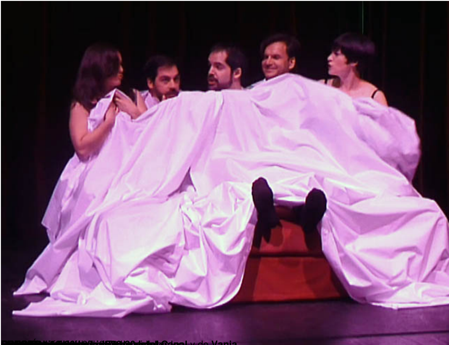
Escena de la ópera de cuatro notas de Johnson-Mir y de Vania.

Jueves, 09 de Abril de 2015 09:24 - Actualizado Viernes, 17 de Abril de 2015 11:50