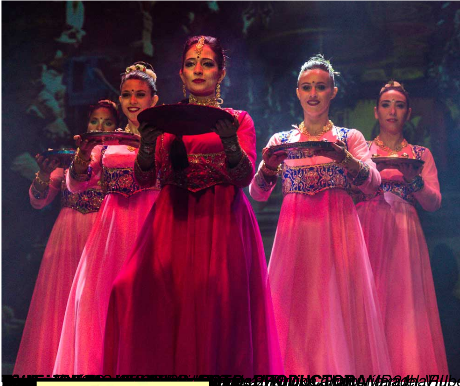
PRODUCCIÓN Wanda Ruba 2018

Jueves, 23 de Agosto de 2018 18:56 - Actualizado Viernes, 24 de Agosto de 2018 09:22