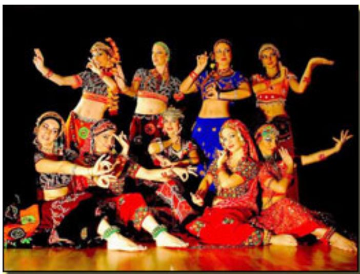
Fenicia Compañía de Danzas Orientales el Teatro Cartografías de la El programa del segundo Nassam Alayna el nombre de