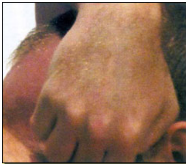
veces me comporto como un extraterrestro, exagerado, c