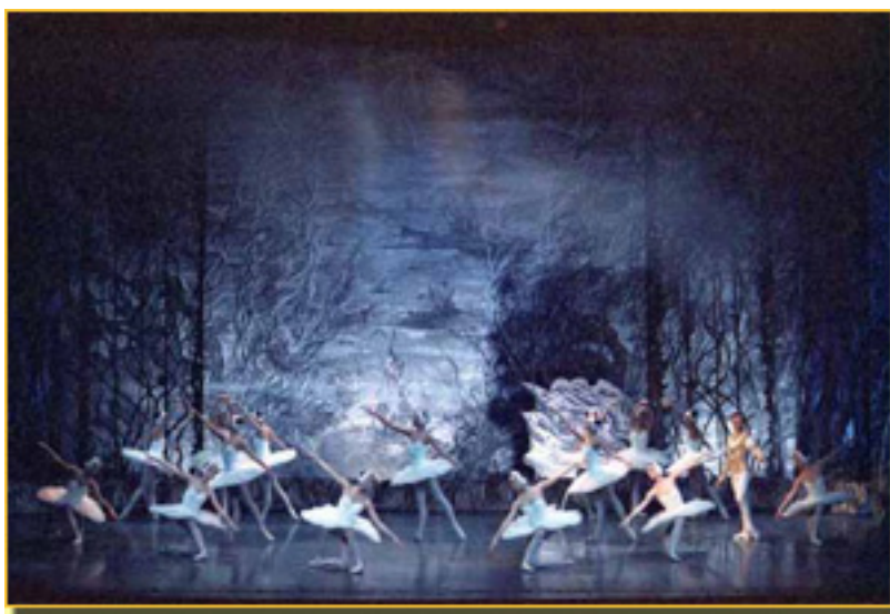
EL LAGO DE LOS CISNES

- Lo he propuesto a la Comunidad de Madrid , pero no ha interesado. Entonces no puedes arrie