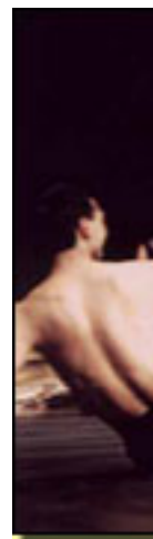
Nefés

Nefés es un espectáculo ambicioso, limpio y brillante. De espléndida factura formal, fiel a su estética, original y poderoso. Las tres horas de duración transcurren ligeras, conducidas por el lirismo sutil de la coreografía y por el leve humor de una cuidada, aunque imperceptible, dramaturgia. La reacción entusiasmada del público al final de la función parecía sancionar inequívocamente la aprobación al trabajo de la coreógrafa alemana.