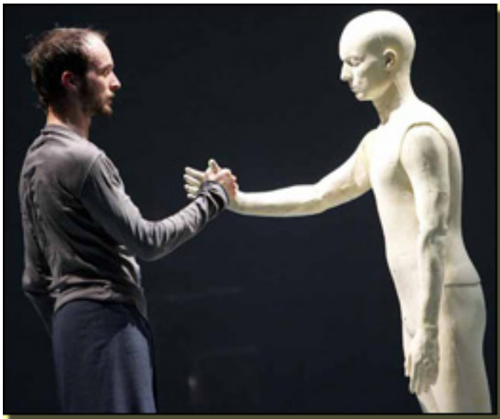
Sidi Larbi Cherkaoui

Martes, 13 de Abril de 2010 19:43 - Actualizado Martes, 11 de Mayo de 2010 09:06