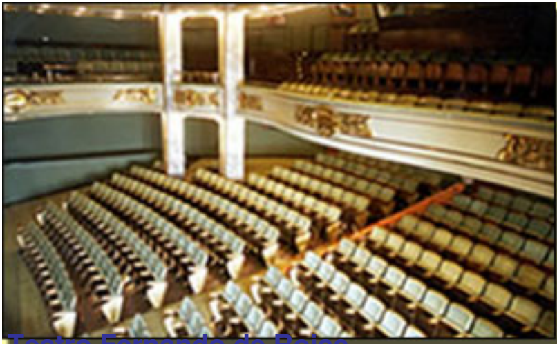
Teatro Fernando de Rojas

Viernes, 26 de Febrero de 2010 14:36 - Actualizado Domingo, 25 de Abril de 2010 16:52