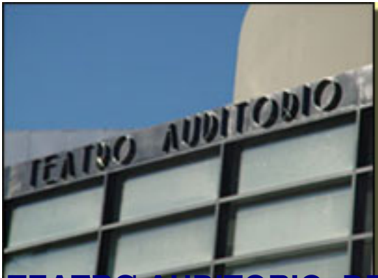
TEATRO AUDITORIO, DE ROQUETAS DE MAR.

Viernes, 26 de Febrero de 2010 15:15 - Actualizado Domingo, 25 de Abril de 2010 16:34