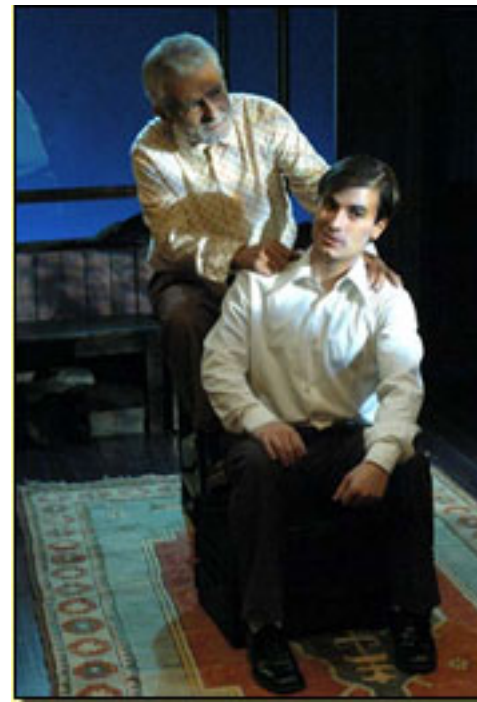
La versión española de la obra, en la parte - “ Nos quedamos impresionados os” va por el propio C

A la versión cinematográfica (Premio César 2004, Premio del Público del Festival de de Venecia 2003 y seleccionada para los Globos de Oro como la mejor película extranjera) le habían precedido, ya, dos adaptaciones al teatro. La primera de todas se estrenó en diciembre de 1999 con una puesta en escena de Bruno-Abraham Kremer . Tras su éxito en julio de 2001 llega al Festival de Aviñón y en el 2002 se repone en París. A partir de esos momentos es un título obligado y, al día de hoy, sigue en el Théâtre Marigny de París.